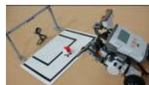
ドキドキPK W杯の興奮を親子で実現！