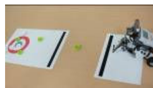
カーリング 親子で目指せソチ五輪

「デスクロボ」シリーズは、ご家庭で楽しく学べるよう、ロボットキットと専用のテキストやコースがセットとなった教材です。ロボットスポーツ編は5種類のスポーツを、ロボットをつかって親子で楽しめます。小学3年生～中学1年生くらいを対象としています。