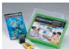
チームチャレンジ セット