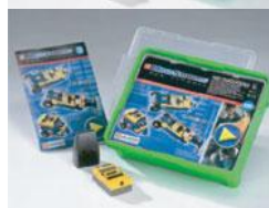
ロボテクノロジー セット