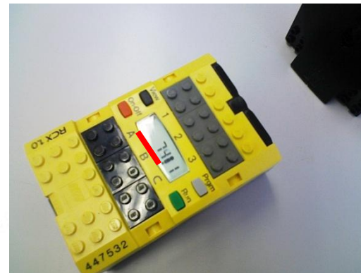
同じ範囲の数字を何度も繰り返すことがあります