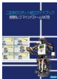
二足歩行ロボ組立ガイド