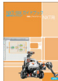
プログラミング教材 NXT-SW1.0 入門ガイド