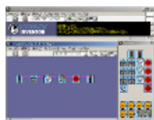
プログラム作成ソフトウェア ROBOLAB2.9