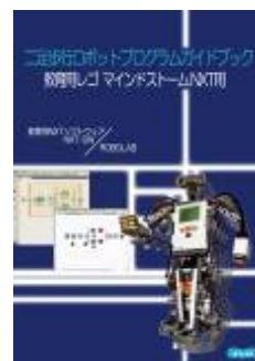
二足歩行ロボ プログラムガイド

ROBOLAB2.9 NXT-SW1.0 のいずれか選択 プログラム作成ソフトウェアは、