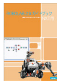
プログラミング教材 ROBOLAB2.9 入門ガイド