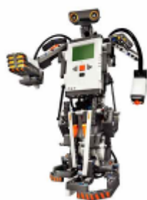
(組立例:二足歩行ロボ)