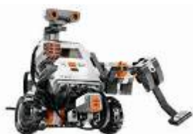
教育用レゴ マインドストーム NXT (組立例:ホッケーロボ)